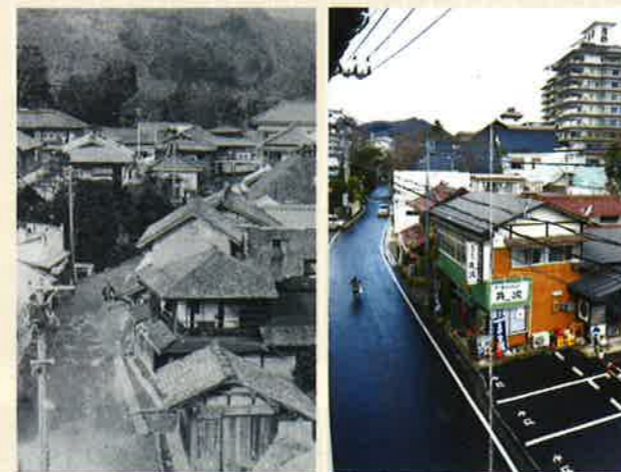
大正時代の温泉場(写真左)と現在(写真右)。現在の「筑波」の場所には下駄屋さんがありました。