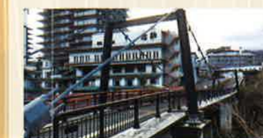
平成22年にコンクリート橋の隣に吊り橋が復元されました(歩道専用)。