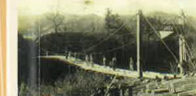
戦後、昭和24年、地域住民によって吊り橋が架けられました(工事中)。