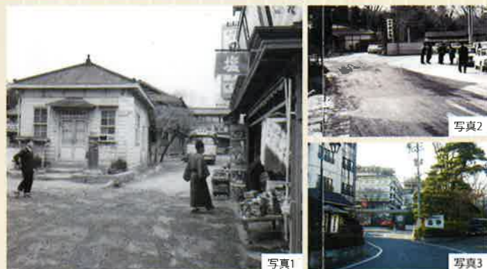
写真2は昭和40年代の旧共同浴場移転後の様子(奥に見えるのが水戸屋)、写真3は現在の様子。

温泉場の中心地、三叉路。元湯4軒の他、昭和30年頃まで源泉・共同浴場、郵便局(写真1左)や、さいち(写真1右端)がありました。