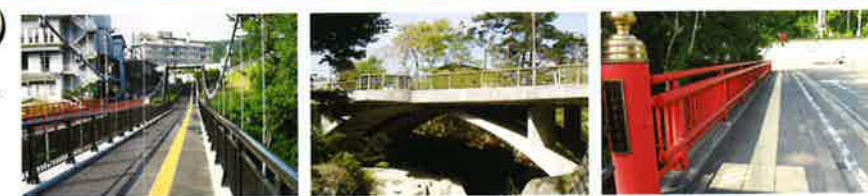
1 湯の橋 2 覗橋 3 新秋保橋

名取川の景観が気持ちいい秋保温泉を代表する3つの橋。それぞれに四季折々の自然美豊かなビューポイントとして人気があります。